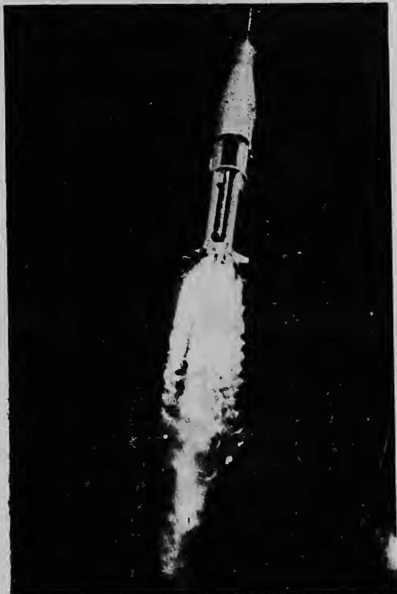
E gigantesco cohete Saturno Apolo a causa un columna di candela mes grandi cune mes mientras e tabata desapareciendo den espa- cio. E gigante aki ta produci un forza di empuhe di 1,6 million li- ber y ta pisa 45,000 liber.

E satelite ESSA a costa como 2.600.00 dollar.